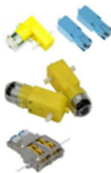
Figura 1. Motores permitidos

Art 2.6 Requisito obligatorio, el robot debe construirse con motores con caja de reducción amarilla o azul, en cualquiera de sus variaciones y relaciones de transmisión como los que se muestran en la figura 1.